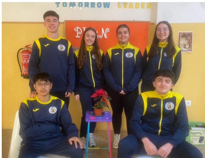
Alumnado 4º ESO colegio Episcopal OM EKUMENE Almansa

Para finalizar, nos gustaría destacar la frase que más se ha escuchado en estos meses desde que ocurrió la tragedia: “El pueblo salva al pueblo”, la cual ha demostrado que siempre estamos allí para los que lo necesitan y que los jóvenes han estado totalmente implicados en esto. Por lo tanto, por ser jóvenes no significa que sean más vagos, con menos corazón y humanidad que otras personas o que les de igual lo que ocurre en su país, y esto es algo de lo que todo el mundo debería de estar informado y orgulloso, ya que los jóvenes como el futuro que son han demostrado muchas cosas.