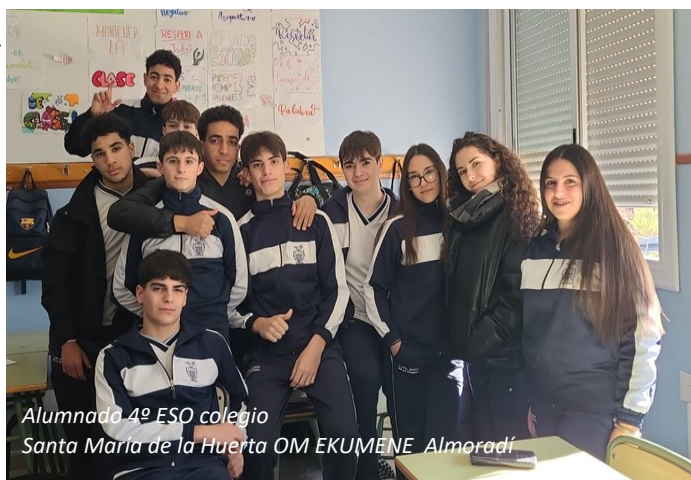
Alumnado 4º ESO colegio Santa María de la Huerta OM EKUMENE Almoradí

Este lado solidario que han mostrado los jóvenes ha sorprendido positivamente a la sociedad española, contrastando con los comentarios de que estas generaciones eran poco trabajadoras o “de cristal”, que, seamos sinceros, se trataban de falacias.