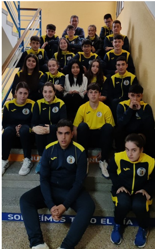
Alumnado 4º ESO Colegio Episcopal Almansa

Los temas de los que nos gustaría hablar para luego publicar en la revista “El Mundo nos espera” son: La DANA de Valencia; tendencias actuales de moda; el acoso escolar; la religión en la juventud y en la adolescencia y la salud mental entre los jóvenes.